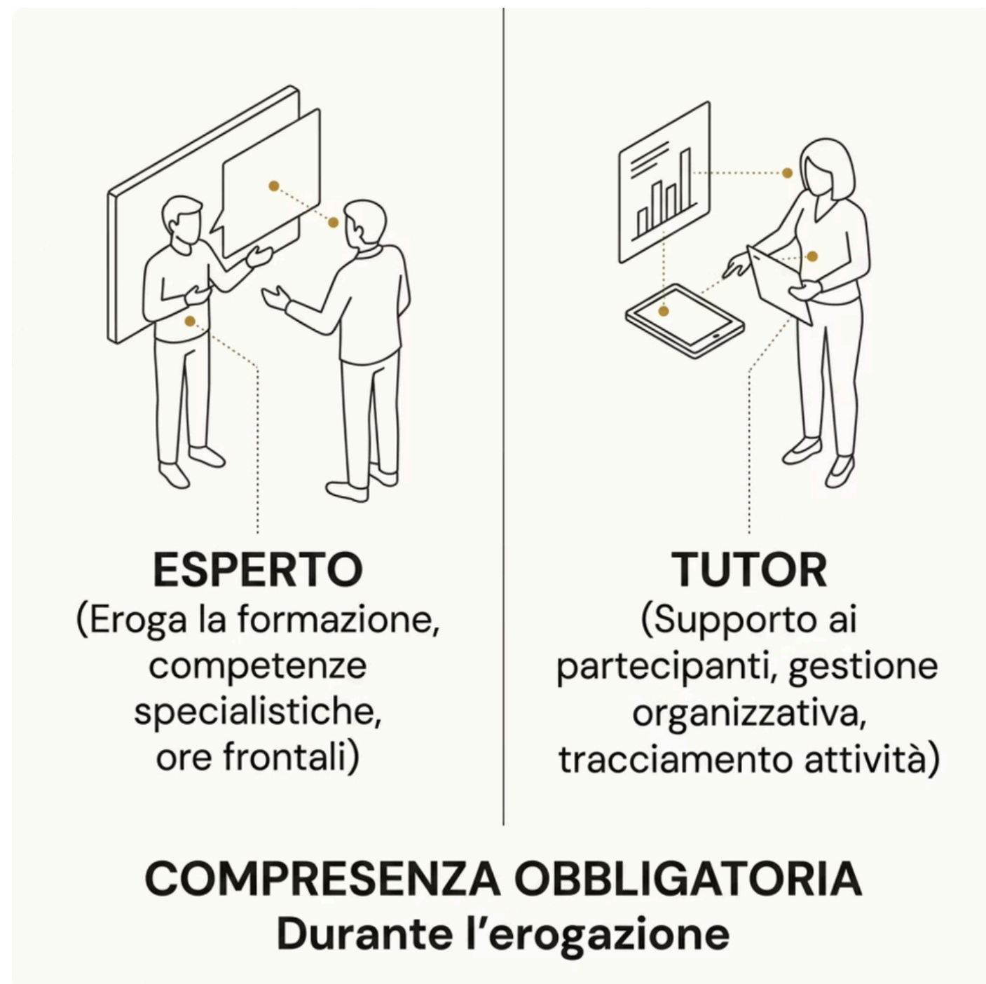
Figure professionali obbligatorie

Ogni modulo prevede la compresenza obbligatoria di due figure professionali con ruoli distinti e complementari.